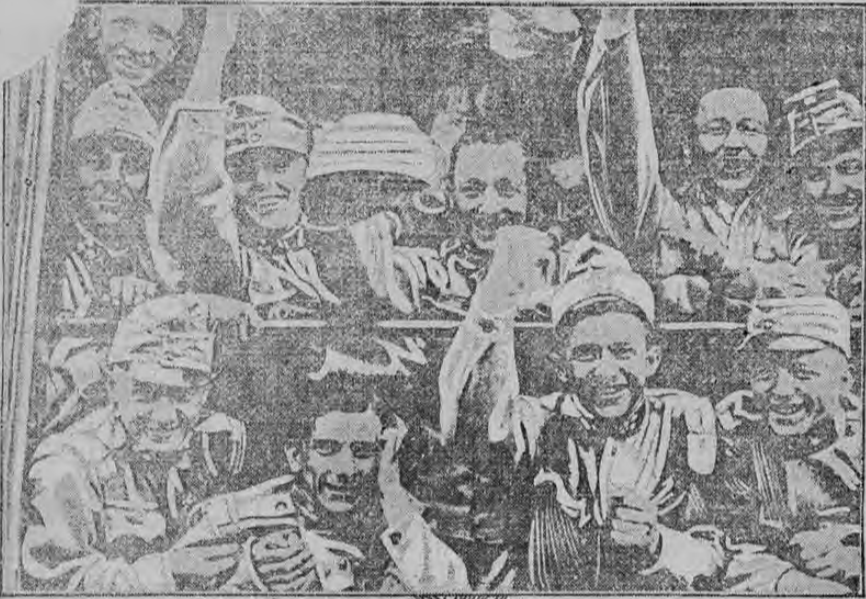
LAUGHING AUSTRIAN SOLDIERS LEAVING VIENNA FOR GALICIA

Con la sonrisa en los labios, partieron para la guerra, sin imaginarse siquiera que esta sería la última fotografía que de ellos se tomara